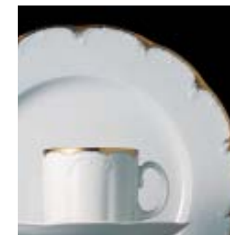
RAMBOUILLET 30 00 20