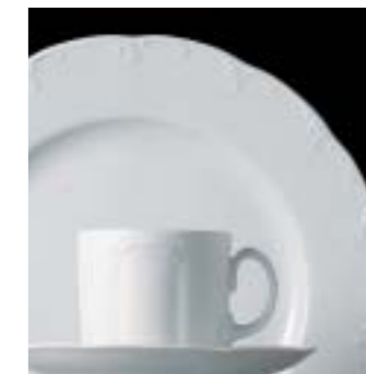
WEISS 80 00 01