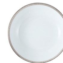
Réf. 26 Assiette creuse calotte 19 cm Coupe soup 7.5"