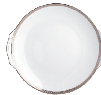
Réf. 97 Plat à gâteaux 27 cm Cake plate with handles 11"