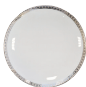
*Réf. 2553 Assiette coupe 16 cm Coupe bread & butter plate 6.5"