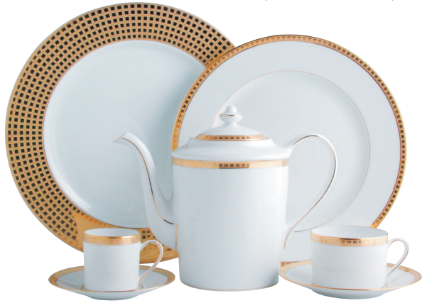
ATHENA OR/GOLD Réf. 0467

OR / PLATINE / NAVY GOLD / PLATINUM / NAVY