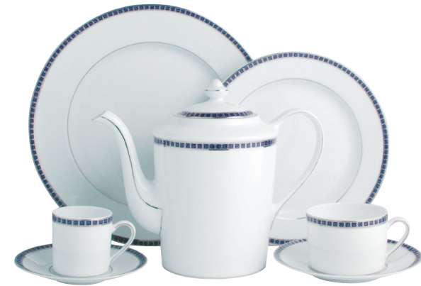
ATHENA NAVY/NAVY Réf. 0464