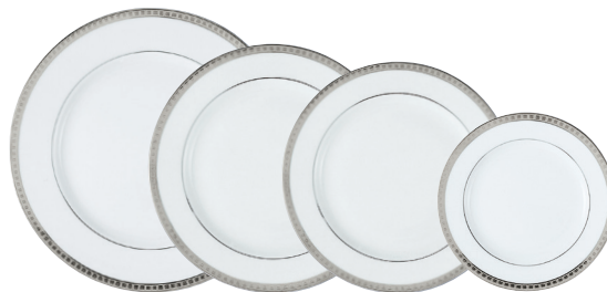
Réf. 13 Assiette plate 26 cm Dinner plate 10.5"