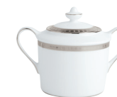
Réf. 155 Sucrier (20 cl) Sugar bowl (7 oz)