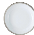
Réf. 55 Coupelle 13 cm Fruit saucer 5"