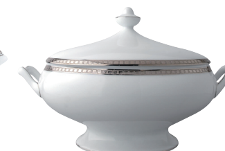
Réf. 69 Légumier (1 L) Covered vegetable dish (34 oz)