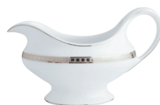
Réf. 133 Saucière (25 cl) Gravy boat (8.5 oz)