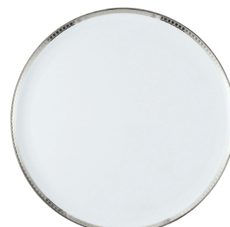
Réf. 121 Plat à tarte 32 cm Round tart platter 13"