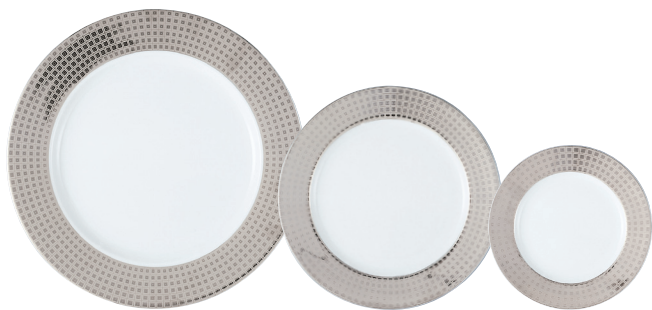
Réf. 7 (or/gold - platine/platinum) Assiette de présentation 29,5 cm Service plate 11.5"

OR / PLATINE / NAVY GOLD / PLATINUM / NAVY