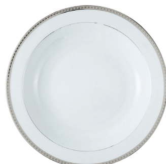
Réf. 115 Plat rond creux 29 cm Deep round dish 11.5"