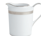
Réf. 57 Crémier (30 cl) Creamer (10 oz)