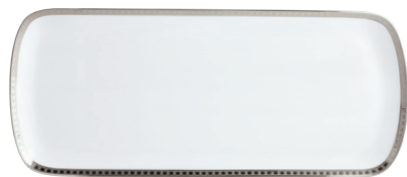
Réf. 95 Plat à cake 37 cm Rectangular cake platter 15"

OR / PLATINE / NAVY GOLD / PLATINUM / NAVY