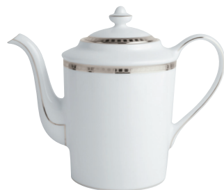
Réf. 34 Cafetière (1 L) Coffee pot (34 oz)