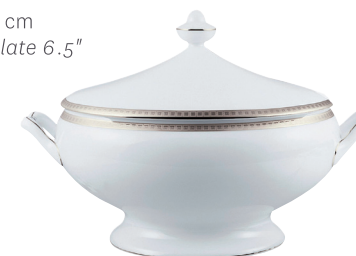
Réf. 147 Soupière (2 L) Soup tureen (68 oz)