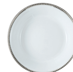
Réf. 53 Compotier creux 24 cm (80 cl) Open vegetable dish 9.5" (27 oz)