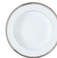
Réf. 23 Assiette creuse à aile 22,5 cm Rim soup 9"