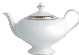
Réf. 183 Théière (75 cl) Tea pot (25.5 oz)