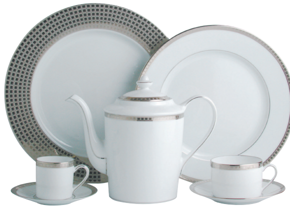
ATHENA PLATINE/PLATINUM Réf. 0448