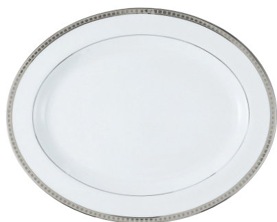
Réf. 105 Plat ovale 43 cm Oval platter 17"