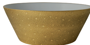
Réf. 0739/131 Saladier PM 20 cm (1,3 L) Small salad bowl 8" (44 oz)