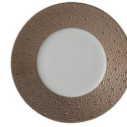
Réf. 0738/20251 Assiette plate 16 cm Bread & butter plate 6.5"