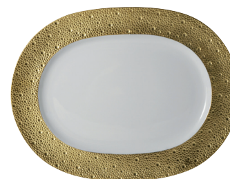
Réf. 0739/21119 Plat ovale 30 cm Oval platter 12"