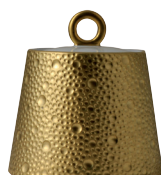
Réf. 0739/20520 Sucrier (25 cl) Sugar bowl (8.5 oz)