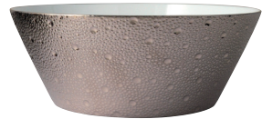
Réf. 0738/131 Saladier PM 20 cm (1,3 L) Small salad bowl 8" (44 oz)