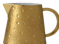
Réf. 0739/20523 Crémier (25 cl) Creamer (8.5 oz)