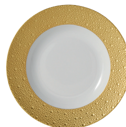
Réf. 0739/20449 Assiette creuse à aile 23 cm Rim soup 9"