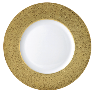
Réf. 0739/20248 Assiette plate 31,5 cm Oversized service plate 12.5"