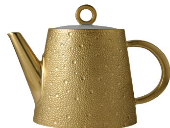
Réf. 0739/20517 Verseuse (1 L) Hot beverage server (34 oz)