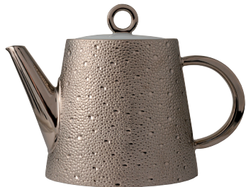
Réf. 0738/20517 Verseuse (1 L) Hot beverage server (34 oz)