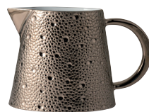
Réf. 0738/20523 Crémier (25 cl) Creamer (8.5 oz)