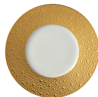
Réf. 0739/20251 Assiette plate 16 cm Bread & butter plate 6.5"