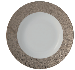
Réf. 0738/20449 Assiette creuse à aile 23 cm Rim soup 9"