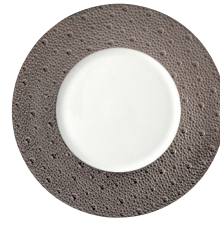
Réf. 0738/20250 Assiette plate 21 cm Salad plate 8.5"