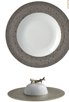
Réf. 0738/21898 Coffret assiette et cloche à caviar D. 18,5 cm Set of caviar plate and bell cover D. 7.1"