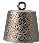
Réf. 0738/20520 Sucrier (25 cl) Sugar bowl (8.5 oz)