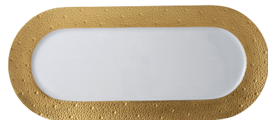
Réf. 0739/95 Plat à cake 37 cm Rectangular cake platter 15"