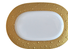
Réf. 0739/125 Ravier 21,5 x 15 cm Relish dish 8.5"x 6"