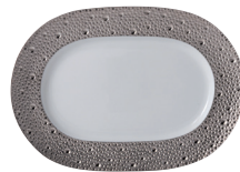
Réf. 0738/125 Ravier 21,5 x 15 cm Relish dish 8.5"x 6"