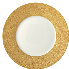
Réf. 0739/20249 Assiette plate 26 cm Dinner plate 10.5"