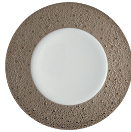
Réf. 0738/20249 Assiette plate 26 cm Dinner plate 10.5"