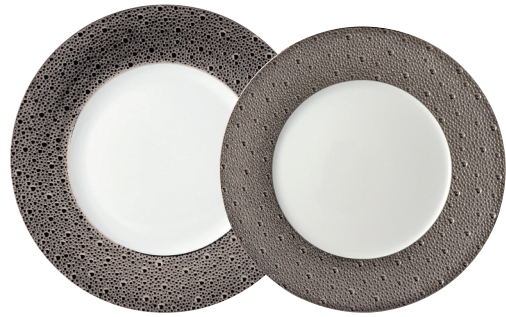
Réf. 0738/20248 Assiette plate 31,5 cm Oversized service plate 12.5"