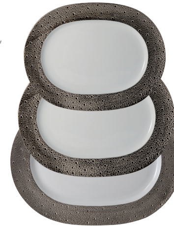
Réf. 0738/21119 Plat ovale 30 cm Oval platter 12"